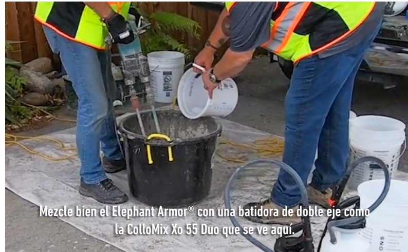
Mezcle bien el Elephant Armor® con una batidora de doble eje como la ColloMix Xo 55 Duo que se ve aquí.