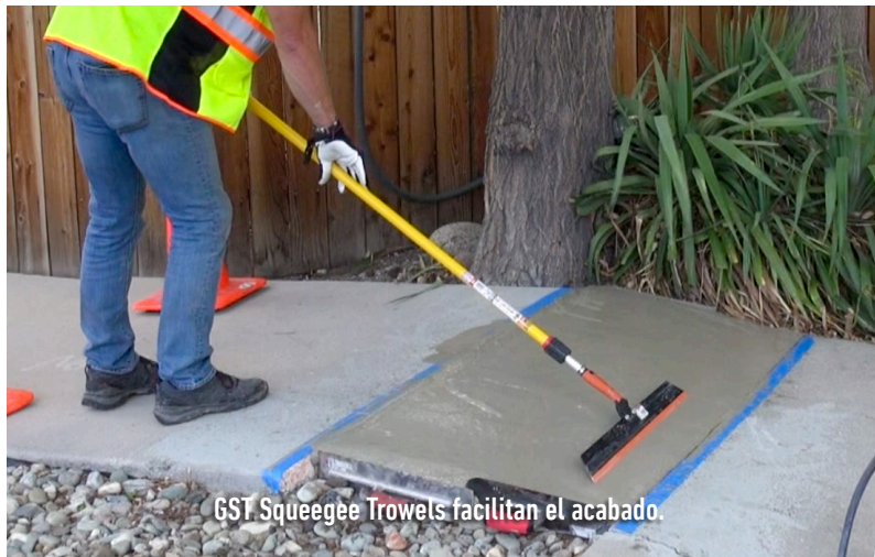
GST Squeegee Trowels facilitan el acabado.