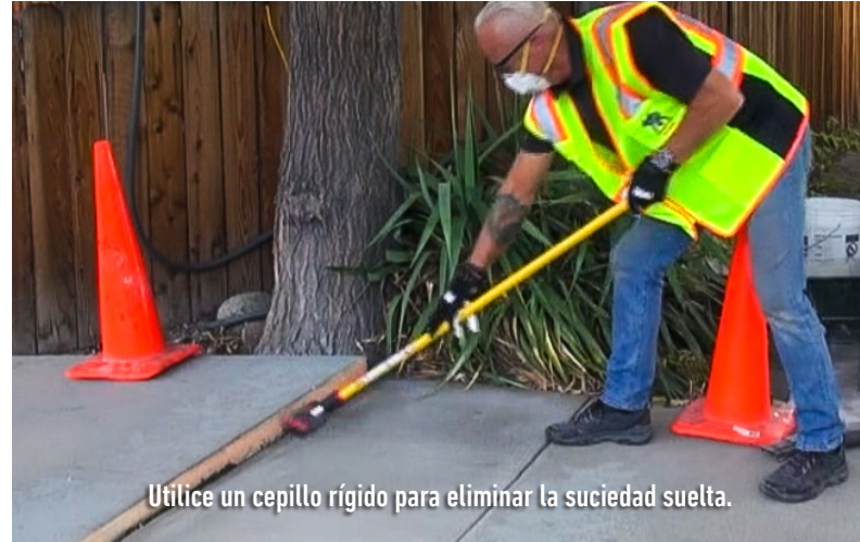
Utilice un cepillo rígido para eliminar la suciedad suelta.

Importante! Es crucial que la capa de lechada no se seque completamente antes de colocar el Elephant Armor®. La característica húmeda y pegajosa de la