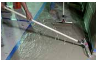
Aplicación de una segunda capa de Elephant Armor®.