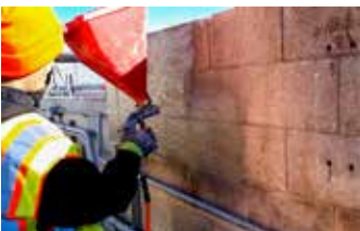
Surface Armor™ se rocía sobre la pared de bloques degradados después de una aplicación inicial de Vetrofluid®.