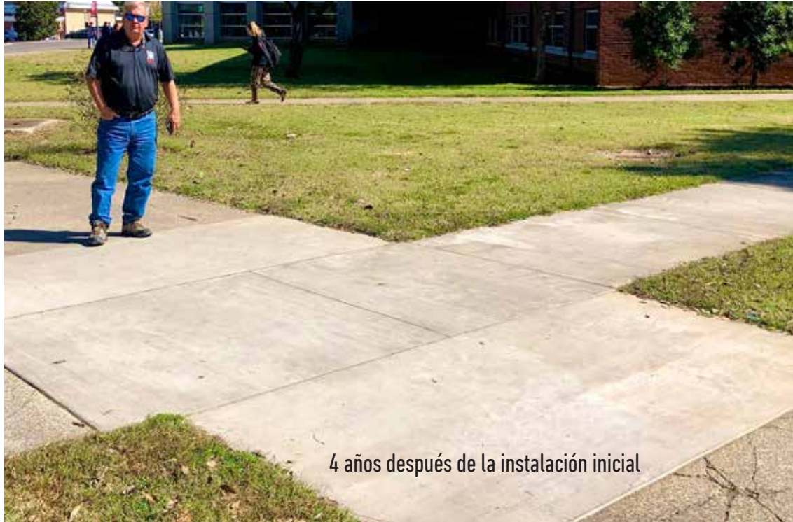
4 años después de la instalación inicial

Se realizó una demostración de reparación de aceras en la Universidad MTSU, comparando el método tradicional de demoler y volver a colar, contra el recubrimiento con Elephant Armor®.