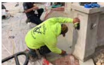
Aplicando el terminado en paredes y columnas.