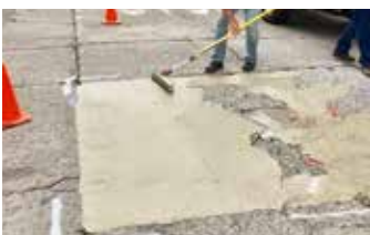
Aplicación de Elephant Armor® a 1/4" (6mm).