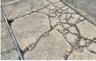
Panel de hormigón severamente degradado, listo para una aplicación de 'relleno y tapado'.