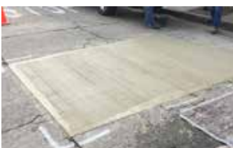
Reparación completada en dos horas y abierta al tráfico en cuatro horas.