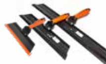
Squeegee Trowels Aplique y termine Elephant Armor® rápida y fácilmente. Disponible en anchos de 12" (305mm), 18" (457mm) y 26" (660mm).