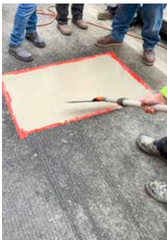
Elephant Armor® se coloca y nivela fácilmente con GST Squeegee Trowels.