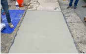
Después de rellenar previamente las grietas, se aplica una capa de Elephant Armor® de 1/4" a la superficie.