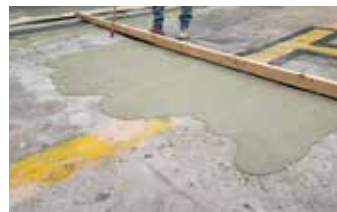
Elephant Armor® se aplica en tres paneles para rellenar y nivelar el área de reparación.