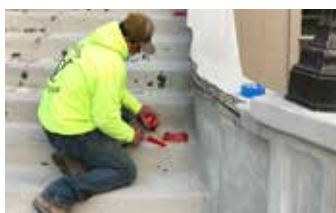
Pasamanos de concreto con secciones faltantes y acero expuesto.