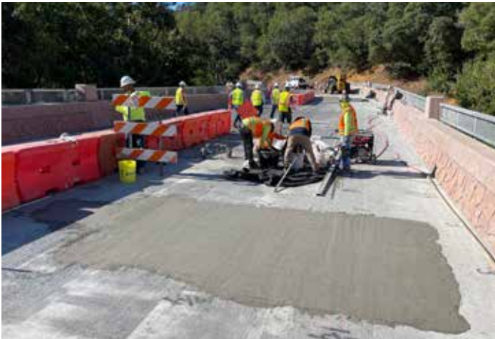
Las zonas con barras de refuerzo expuestas se rellenan y encapsulan con Elephant Armor® antes de la aplicación final de Elephant Armor® DOT.