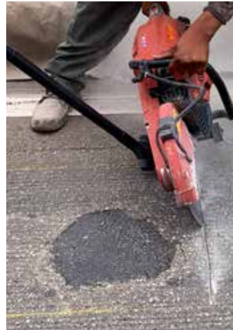
Es importante hacer cortes con una sierra alrededor del perímetro de la zona a reparar.