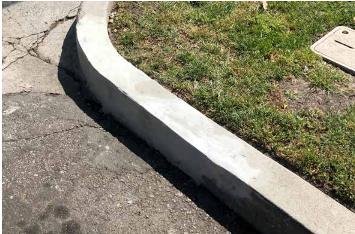
Reparación del bordillo en menos de 1 hora.