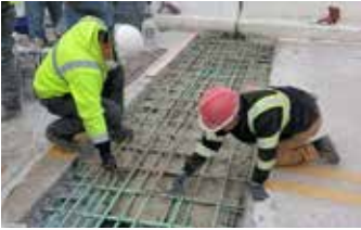
La mezcla fluida de Elephant Armor® garantiza la encapsulación de acero.