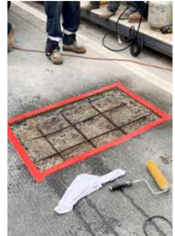
Area de reparación limpia, estable y "seca saturada de superficie" (SSD) antes de la colocación de Elephant Armor®.