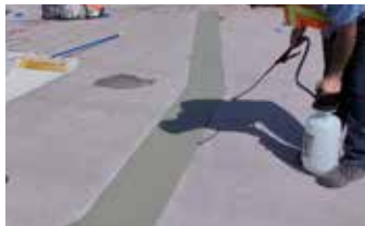
Acabado de la reparación Elephant Armor® con una aplicación de Ecobeton® Vetrofluid®.