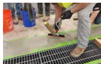
La segunda área dañada en el perímetro exterior del drenaje ahora está cubierta con Elephant Armor®.