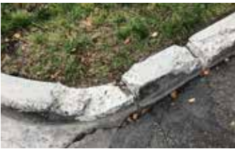
Bordillo severamente dañado.