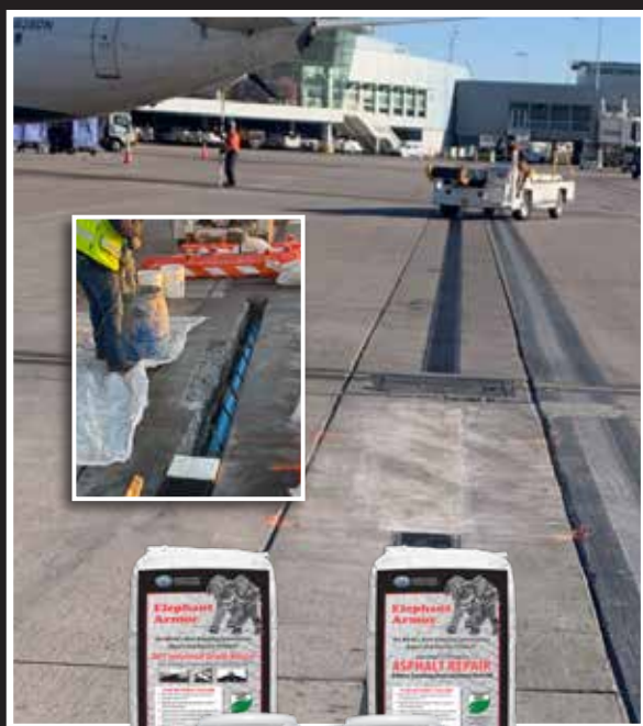
Elephant Armor® DOT

¡El Producto Cementoso de Recubrimiento y Reparación Más Asombroso del Mundo!