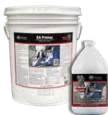
Elephant Armor® Primer es un agente adhesivo de látex de polímero acrílico con alto contenido de sólidos diseñado específicamente para usarse con Elephant Armor® en cualquier superficie de concreto o asfalto. Elephant Armor® Primer no sustituye el agua en ninguna proporción con mezclas estándar de morteros Elephant Armor®.