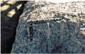
Concreto astillado con varillas expuestas.