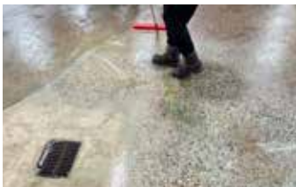
El constante tráfico de vehículos en un entorno húmedo y refrigerado ha provocado un gran desgaste.