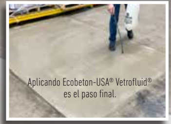
Aplicando Ecobeton-USA® Vetrofluid® es el paso final.