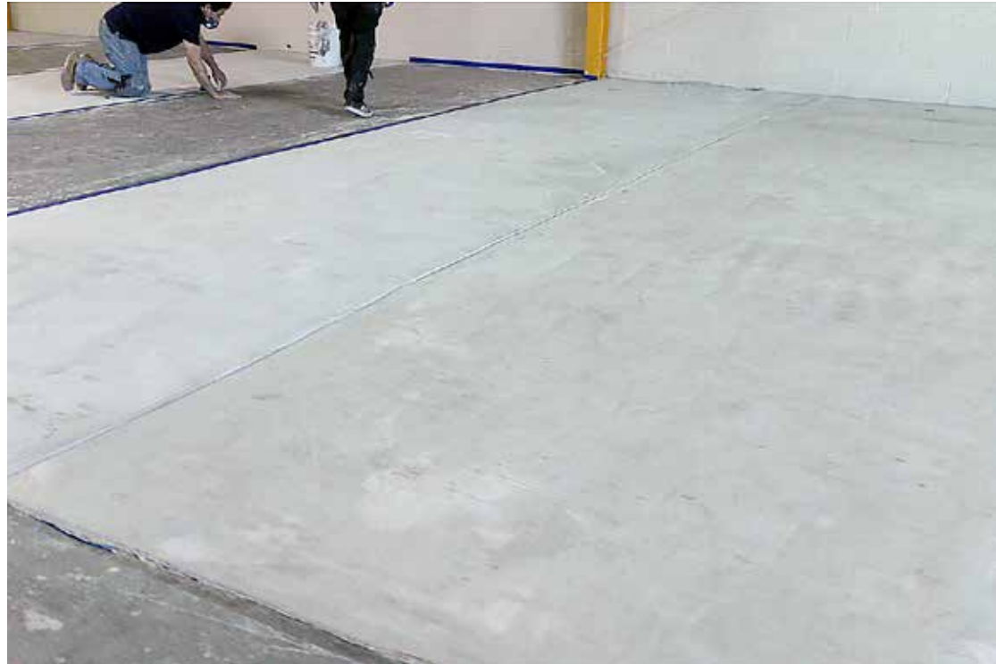
El Elephant Armor® se aplicó en secciones lo que permitió el uso ininterrumpido del almacén.