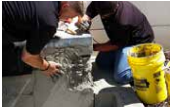
Aplicando Elephant Armor® en la superficie vertical sin cimbrar.