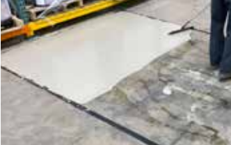
La primera capa de Surface Armor™ con un GST Squeegee Trowel.