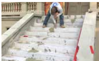
Relleno de grietas y oquedades antes del recubrimiento total.