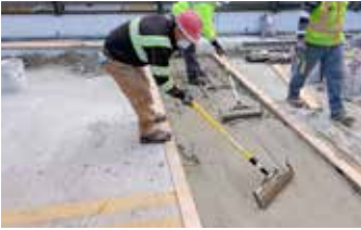
Colocación de material mediante Rodillos de Textura GST.