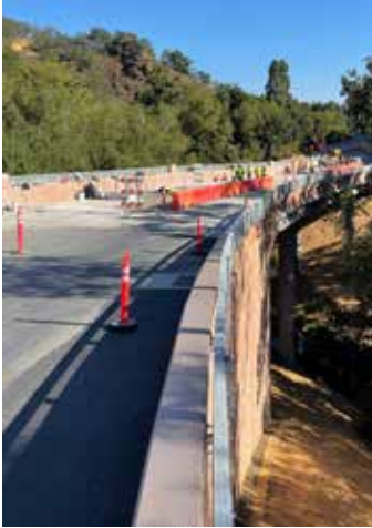
Puente de Alimitos, Santa Clara County, California