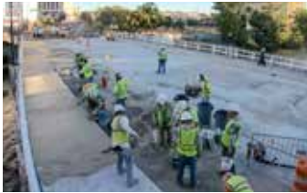
Aplicación de Elephant Armor® utilizando herramientas especializadas GST.