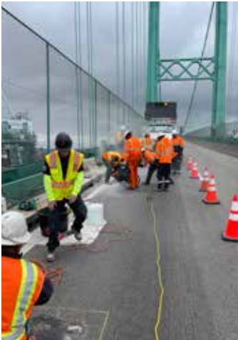
Esta foto muestra un bache rellenado con asfalto en un carril de un puente de hormigón.