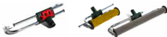
Maneral ajustable de aluminio par a rodillo (rodillos no incluidos) Se muestra el bastidor de rodillos expandible de 9" (230mm) a 18" (457mm) con calibres de profundidad de 1/4" (6mm) y 1/2" (12mm).