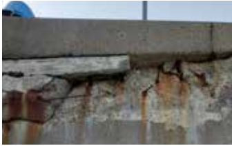
Rompeolas roto y astillado.