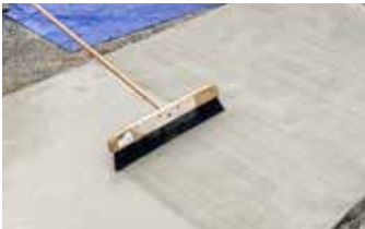
Después de usar un GST Squeegee Trowel para alisar la superficie, se aplica un acabado de escoba.