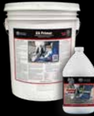
Elephant Armor® Primer