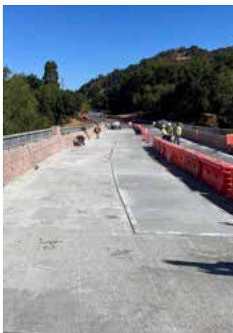
El primer recubrimiento está curado y listo para la segunda capa de 1/2".