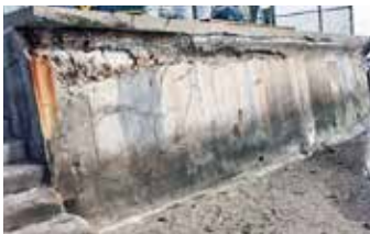
Rompeolas severamente degradado.