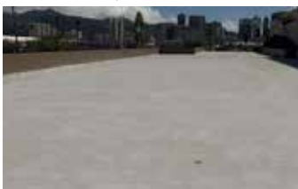
Reparación completa y lista para usar.