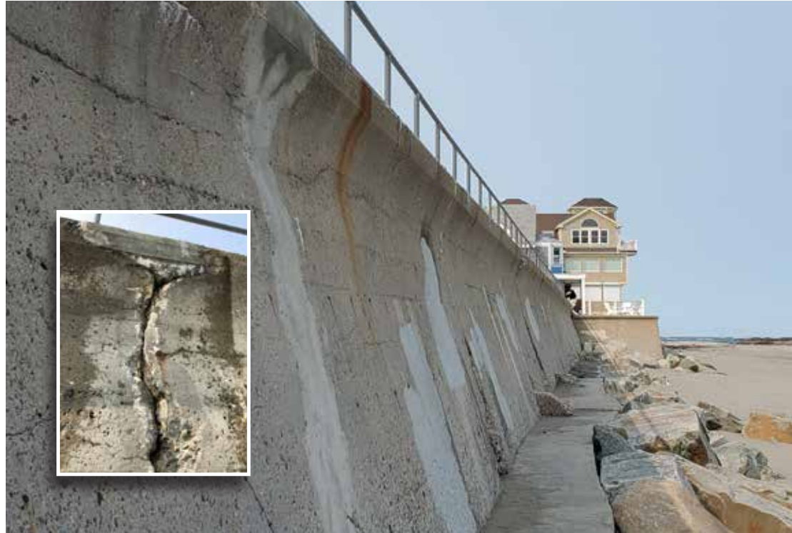
Agrietamientos por efectos del ambiente marino y estar expuesto por décadas a agua salada fueron reparados con Elephant Armor® lográndose un nuevo ciclo de vida para este antiguo rompeolas.