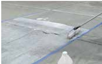
Aplicación de Elephant Armor® Primer.