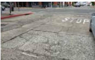
Sección de carretera averiada.