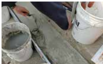
Elephant Armor® aplicado sin utilizar cimbra.