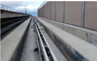
Se aplicaron dos capas de Surface Armor™ para mayor durabilidad y textura.