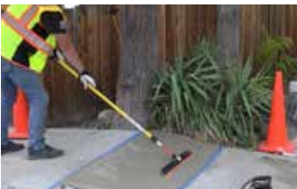
Preparación de la superficie para un acabado con escoba.