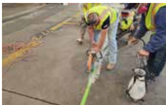
Se hacen cortes limpios alrededor del perímetro del área a reparar.

Se utilizó una combinación de Elephant Armor®, seguida de una capa de desgaste de Surface Armor™, para completar esta importante reparación. El relleno volumétrico, así como la remediación del descascaramiento y grietas profundas se realizaron con Elephant Armor® después de aplicar Ecobeton - USA® Vetrofluid® para estabilizar la superficie de concreto existente. Luego se usó Surface Armor™ para acabar la reparación con una capa muy delgada, mejorando la apariencia de la superficie. Luego se realizó una aplicación final de Ecobeton - USA® Vetrofluid® para mejorar en gran medida la durabilidad y extender el ciclo de vida. Elephant Armor® y el Sistema Surface Armor™ redujeron significativamente los costos en comparación con un escenario de 'quitar y reemplazar'.