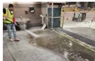
Se lava el área a reparar y se retira todo el material suelto.