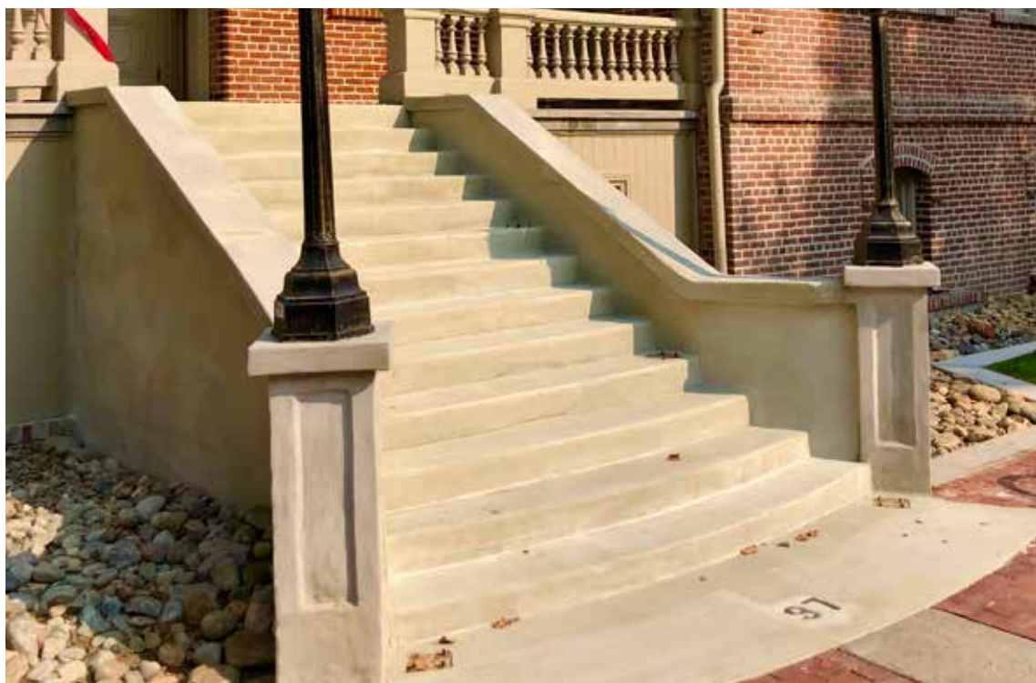
Las escaleras fueron completamente restauradas sin tener que demoler y volver a construir, ahorrándose tiempo y costo y con mínima interrupción del servicio.