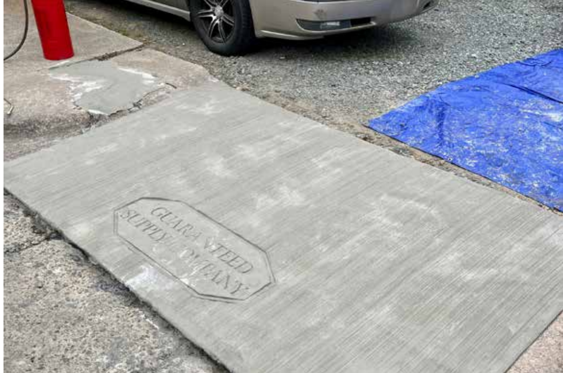
Reparación terminada, estampada con el logo de Guaranteed Supply Company. Ecobeton®- USA VetroFluid® se aplica como último paso después de que la reparación Elephant Armor® haya logrado un curado completo.