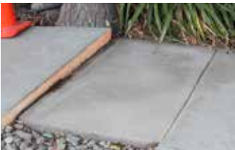
El desnivel en la acera representa un fuerte riesgo de tropezar y caer.