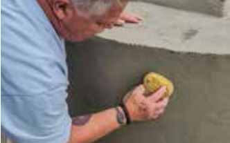
Se utiliza una esponja húmeda para alisar la Surface Armor™ y darle una textura suave.