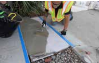
Aplicación de Elephant Armor® utilizando un Rodillo de Textura GST.