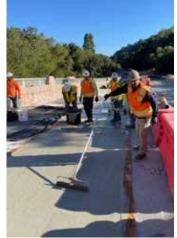
La primera capa de 1/2" de Elephant Armor aplicándose al tablero del puente.