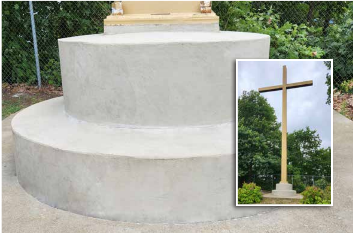
La facilidad de uso de Surface Armor y su rápido tiempo de fraguado permitieron reparar la base de forma permanente en menos de 2 horas, con una interrupción mínima del santuario.