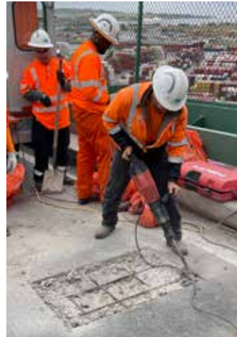
Retirar la superficie dañada y limpiar cualquier material suelto con una escoba y un soplador.