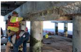
Aplicación del Elephant Armor® sobre la superficie debidamente preparada y con el primario.