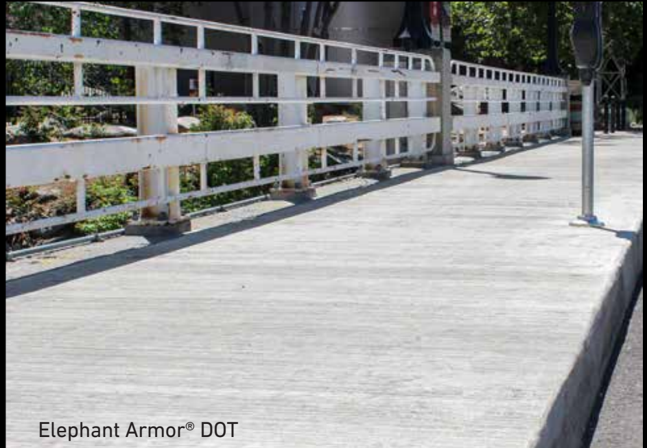
Elephant Armor® DOT