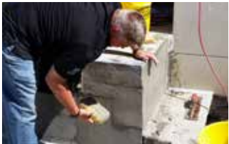
Acabado final con cepillo tipo brocha.