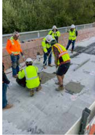
Aplicación de Elephant Armor® como material de relleno alrededor del acero expuesto.