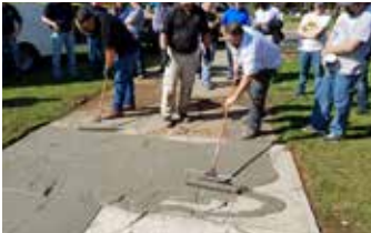
Aplicación de lechada de Elephant Armor® para relleno de grietas y en área general.