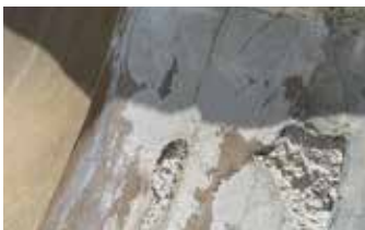
Superficie de concreto dañada que no es segura para su uso.