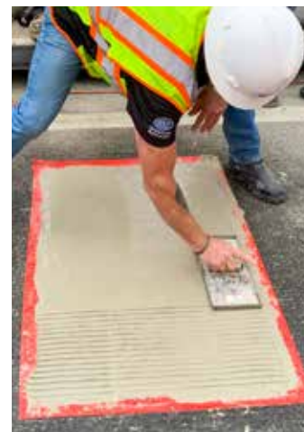
Usar una lana con ranuras para simular la textura existente de la superficie del puente.