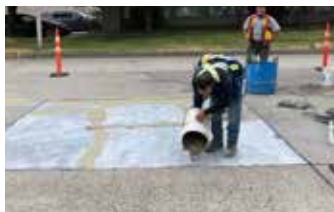
Zona preparada con Elephant Armor® Primer.