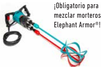
¡Obligatorio para mezclar morteros Elephant Armor®!