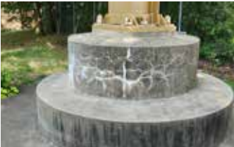
Hormigón envejecido que muestra grietas y calcio y formación de moho debido a la retención de agua.