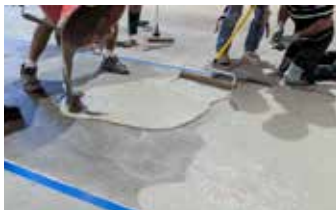
Los rodillos calibrados GST se utilizan para aplicar Elephant Armor® con un grosor constante de 1/4" (6mm).