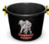
Balde mezclador Elephant Armor® De polipropileno para uso pesado con capacidad para 4 bolsas de Elephant Armor®. Diseñado integralmente con la carretilla Elephant Armor®.