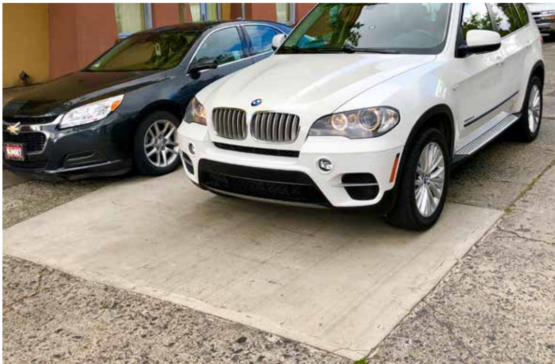
Esta sección de carretera recubierta con Elephant Armor® continúa funcionando perfectamente 5 años después de su reparación. Al evitar la demolición y re-corado, se reduce el tiempo de la reparación substancialmente y el costo hasta en un 50%. Con el nuevo ciclo de vida el impacto ambiental se minimiza.