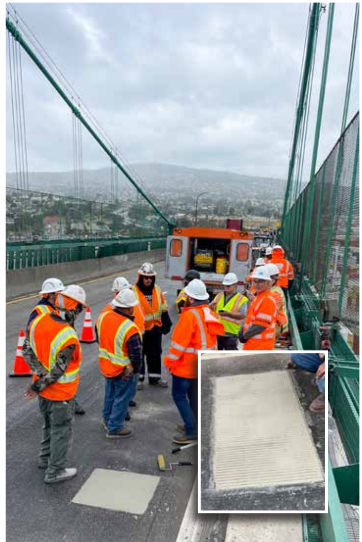
La facilidad de uso y el rápido tiempo de fraguado de Elephant Armor permitieron reparar de forma definitiva el bache con una interrupción mínima del tráfico del puente. Este carril volvió a estar en servicio en menos de 3 horas.