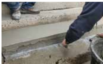
Dando los toques finales a la reparación.