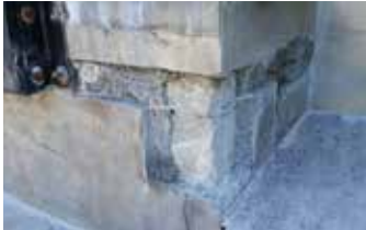
Daños extremos en el andén de carga.