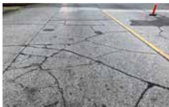
Pavimento de concreto envejecido.