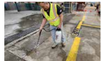
Se aplica una capa de Ecobeton® - USA Vetrofluid® para estabilizar el hormigón existente.