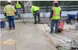
Poniendo el acabado final en el nuevo enlace del puente.