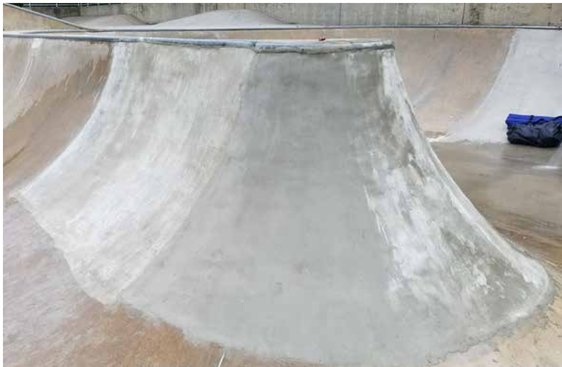
Restauración completa del concreto deteriorado con Elephant Armor®.