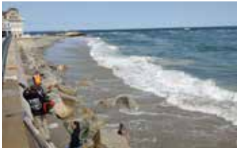
Reparación completada durante el ciclo de marea baja.