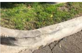
La reparación con Elephant Armor® puede soportar el uso pesado inmediatamente.