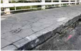
Acera muy agrietada y con delaminado del concreto.