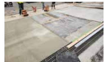
El último panel está listo para ser llenado y nivelado con los dos paneles exteriores.