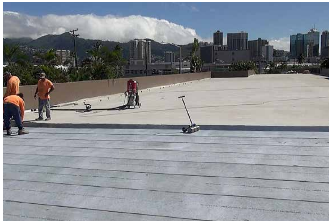
Elephant Armor® es la solución ideal para la reparación de obras de infraestructura urbana de concreto, logrando ahorros sustanciales en tiempo de ejecución y costo.