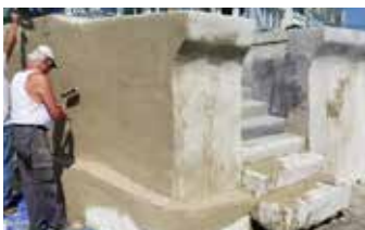
Aplicación de Elephant Armor® en pared.