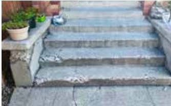
Escalera muy desconchada y degradada, debidamente limpiada y sellada con Ecobeton® Vetrofluid®.