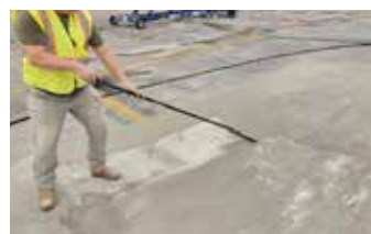
Se aplica una capa de Surface Armor™ sobre toda el área reparada (rellenada).