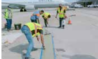
La capa de Elephant Armor® se coloca utilizando una llana para bordes y un Squeegee.