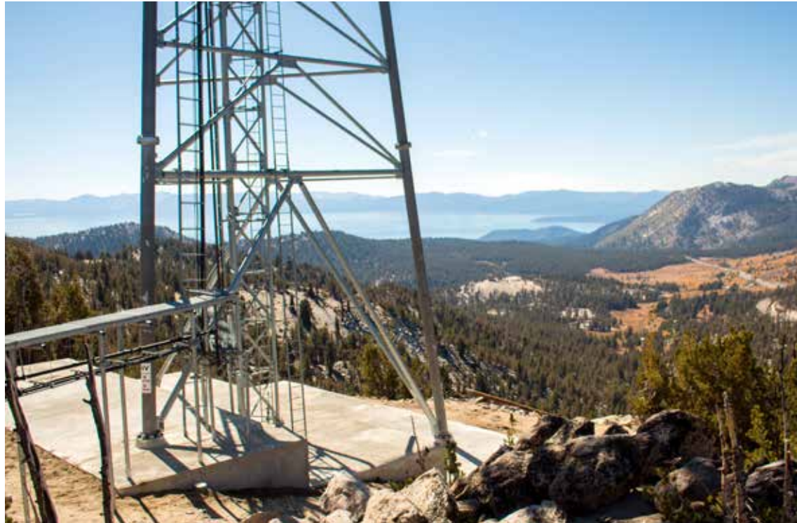
Elephant Armor® se utilizó con éxito en el entorno duro y remoto de Mount Rose en las montañas de Sierra Nevada, donde el acceso con métodos convencionales sería muy costoso.