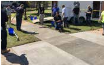
Afinado del Elephant Armor® con un jalador GST antes de aplicar un acabado escobillado.