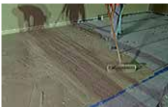
Aplicación de la primera capa de Elephant Armor® sobre la membrana impermeabilizante.