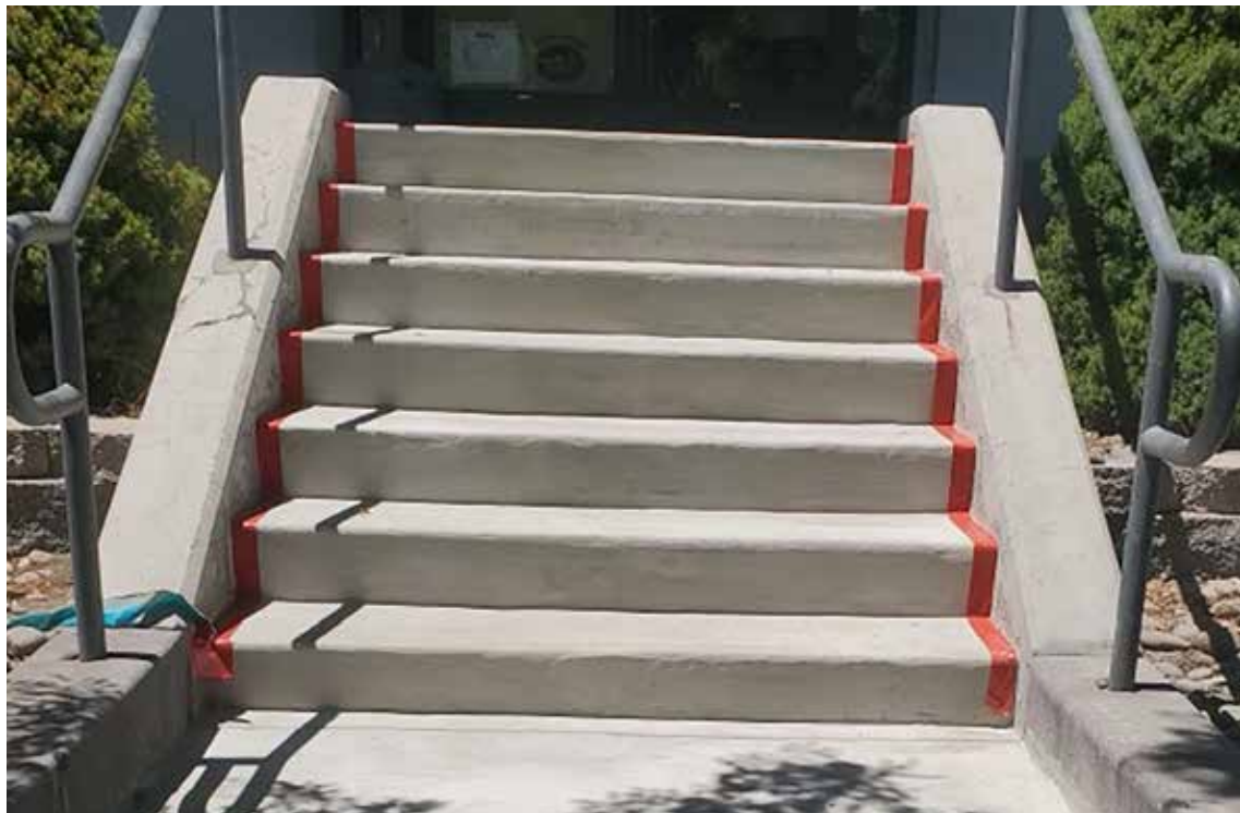
Peldaños de escaleras severamente desgastados y rotos quedaron como nuevos, extendiendo el ciclo de vida con Elephant Armor®. Reparación realizada por Morgan Construction, Reno, NV.