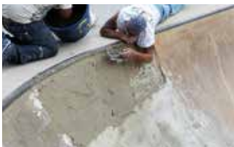
Elephant Armor® aplicado sobre Elephant Armor® Primer.