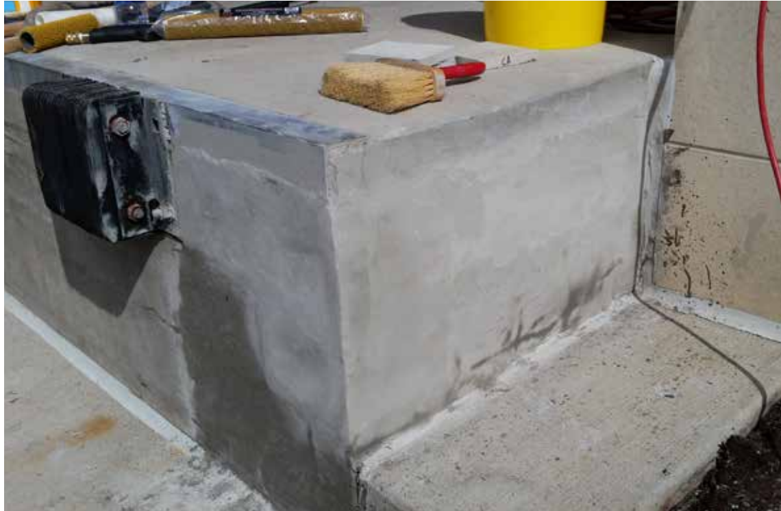
El andén finalmente reparado. Al no requerirse cimbra, la ejecución del trabajo fue muy rápida y su secado y endurecimiento acelerado evita interrumpir las operaciones.