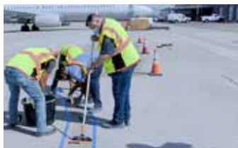
Relleno de grietas con Elephant Armor® utilizando un rodillo y un GST Squeegee Trowel.