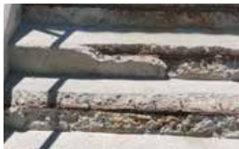
Escaleras de concreto degradadas hasta acero expuesto.