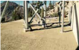
Torre de Televisión de CBS completó la reconstrucción en solo 4 días.