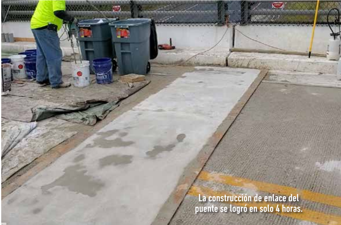
La construcción de enlace del puente se logró en solo 4 horas.

Se eligió Elephant Armor® debido a su alta resistencia a compresión, flexión y tracción. Su propiedad de fraguado acelerado permite reabrir el tramo a servicio rápidamente.