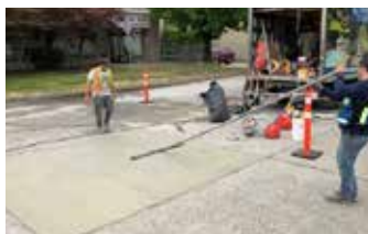
Terminado final del Elephant Armor en capa de 1/4" (6mm).