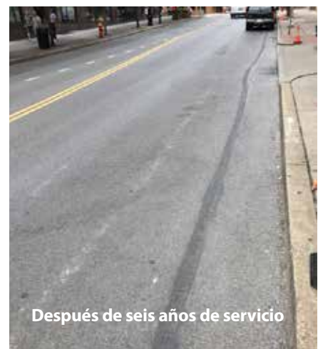
Después de seis años de servicio