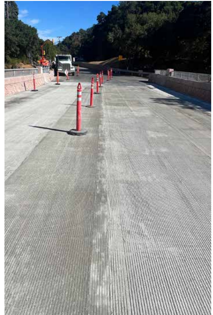
Finalización de la repavimentación del tablero del puente en aproximadamente una semana.