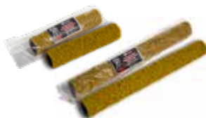
Rodillo texturizado de 9" (230mm) and 18" (457mm)