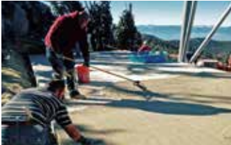
Elephant Armor® aplicado con rodillos y llanas GST.