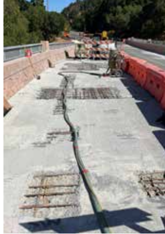
Área de reparación estructural del acero expuesto en el tablero del puente.