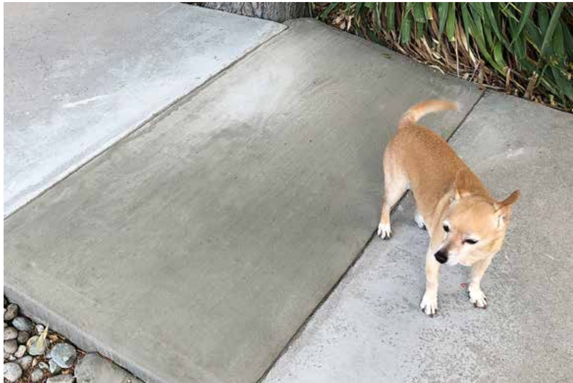
Se eliminó el riesgo de tropiezos y caídas sin tener que retirar el panel defectuoso.