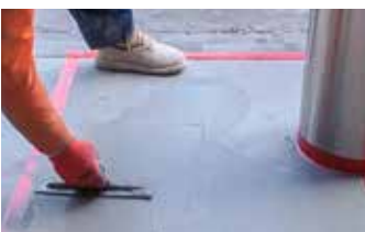
Aplicando la segunda capa de Surface Armor™ a la superficie antes de pasar la escobilla.