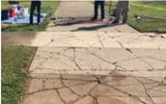
Aceras dañadas antes de su reparación.