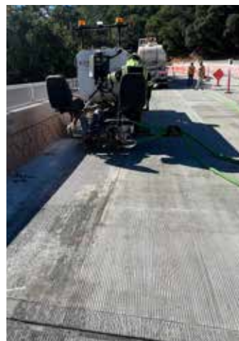
Una vez que la segunda capa se cure, una máquina ranuradora aplica la textura especificada.