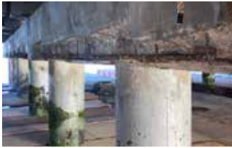
Concreto dañado y en mal estado removido y preparado para la aplicación de Elephant Armor®.