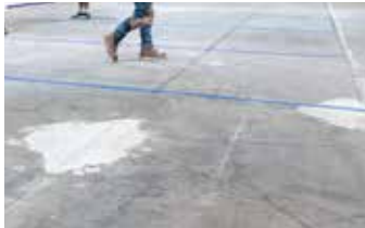
Definición del área de reparación mediante corte de sierra y cinta adhesiva.