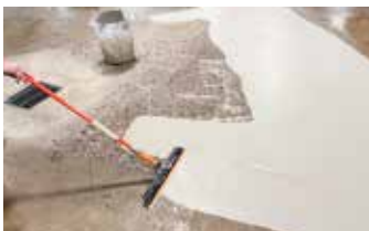
La aplicación de Surface Armor® es rápida y sencilla con un GST Squeegee Trowel.