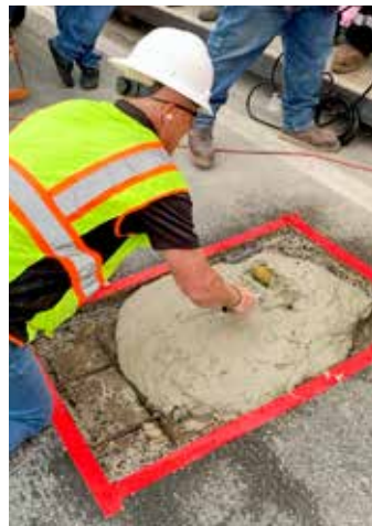
Usar un GST Textured Roller para colocar y extender uniformemente la mezcla de alto contenido de fibra de Elephant Armor®.