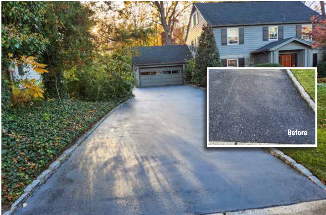
Powder pigment was added to the Surface Armor™ to achieve a similar finish to the original asphalt. The 1250 ft 2 driveway was completely resurfaced in approximately 5 hours.