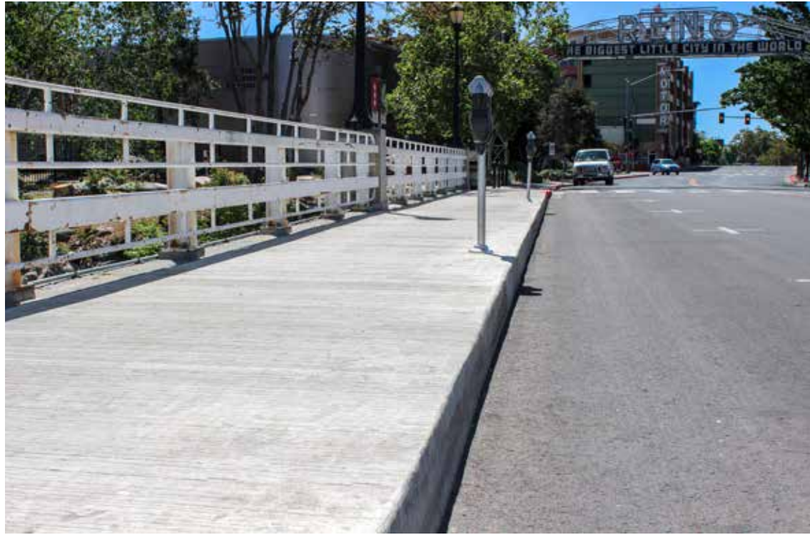
Esta reparación se logró y abrió a tráfico en 4 horas, recortando varias semanas al tiempo de ejecución y un ahorro considerable. Además el rehabilitado representa una disminución sustancial del impacto ambiental.