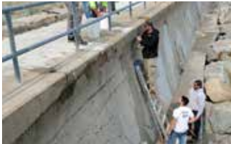
Aplicación de Elephant Armor® en el área de reparación.