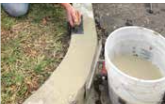
Acabado con doblador del Elephant Armor®.