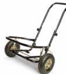
Carretilla Elephant Armor® Facilita los acarreos del Elephant Armor® al área de aplicación en forma rápida.