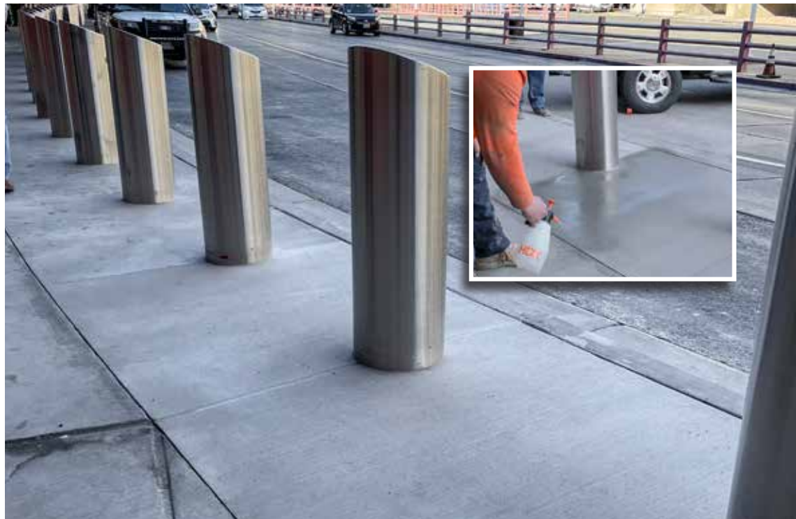
Paneles terminados que muestran una nueva apariencia. La foto del recuadro muestra la aplicación de Ecobeton® - USA Vetrofluid® como paso final del sistema Surface Armor™.