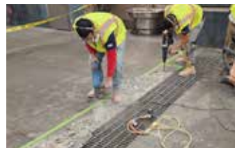
Todo el concreto inestable suelto se desmenuza para proporcionar una superficie sólida.