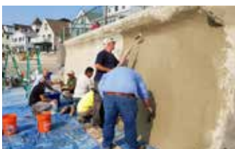
Aplicación y acabado final mediante el rodillo de textura GST.