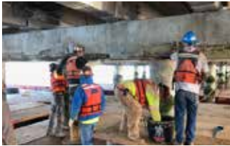
Aplicación de una lechada primer antes de recibir el Elephant Armor®.