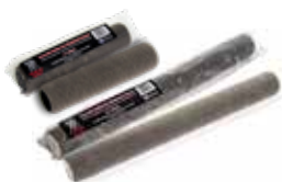
Rodillo liso de 9" (230mm) and 18" (457mm)