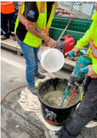
Es fácil preparar el Elephant Armor®, solo agregue agua. Usar el ColloMix Xo 55 Duo para generar el alto cizallamiento necesario para lograr una mezcla homogénea.